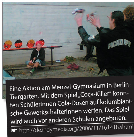
Eine Aktion am Menzel-Gymnasium in Berlin-Tiergarten. Mit dem Spiel „Coca-Killer“ konnten SchülerInnen Cola-Dosen auf kolumbianische GewerkschafterInnen werfen. Das Spiel wird auch vor anderen Schulen angeboten.

Diese Repression diente dazu, die Löhne der