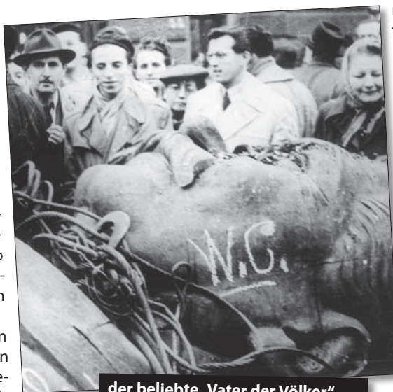
der beliebte „Vater der Völker“ Stalin mit eingeschlagener Fresse

Um die Verbrüderung der Sowjetsoldaten mit den Aufständischen, die bei der ersten Attacke recht oft vorgekommen war, entgegenzuwirken, wurde so gut wie keine Infanterie eingesetzt. Auch waren viele der Soldaten, die nun kämpften, aus dem sowjetischen Hinter-