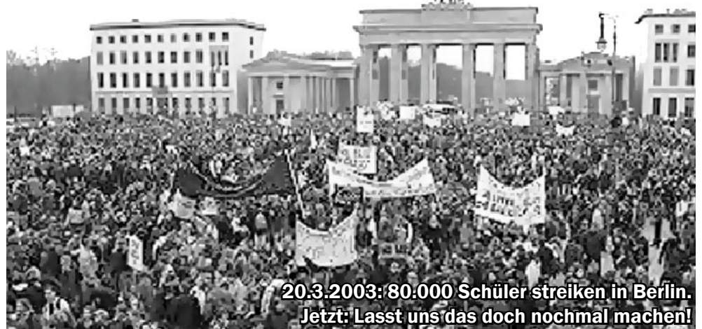
20.3.2003: 80.000 Schüler streiken in Berlin. Jetzt: Lasst uns das doch nochmal machen!

In der Schulzeit wird einem nicht bewusst, unterdrückt zu sein. Gerade als junge Frau fühlt man sich darin bestätigt, alles erlernen zu können, was man mag. „Habe ich die richtigen No-